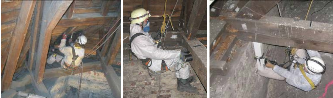
Abbildung 2. links: Handnahe Sichtprüfung sowie Abklopfen der Holzkonstruktion; Mitte: Ultraschallechomessung an als gefährdet eingestuften Holzbalken; rechts: Bohrwiderstandsmessung