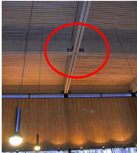
Abbildung 4. Pfarrkirche in Oberbayern mit Brettschichtholz-Trägerrost

Im Rahmen der Untersuchungen erfolgte eine visuelle Untersuchung einschließlich Risstiefenbestimmung sowie Ultraschallechomessungen. Mit dem Ultraschallechoverfahren konnten an den Brettschichtholzträgern Echosignale sowohl in den Bereichen ohne als auch mit Nagelplatten empfangen werden, d. h. verdeckte Bereiche können mit Ultraschallecho untersucht werden. Trotz Rissen auf der zugänglichen Seite wurden deutliche Rückwandechos empfangen, d. h. es kam zu einem Schallübergang und die nicht zugängliche Seite wies keine Risse auf. An einigen Messpunkten konnte trotz intensiver Oberflächenwelle von der Rückseite kein Echo empfangen werden, was basierend auf Erfahrungen als Riss auf der Bauteilrückseite gedeutet werden kann. Es musste also davon ausgegangen werden, dass sich bei einigen Brettschichtholzträgern auf der Rückseite unter den Nagelblechen Risse befinden und somit nicht alle Nägel als voll kraftschlüssig angesetzt werden können. Mit den Messungen konnten genaue Aussagen über den Zustand der Konstruktion getroffen werden, was in der Statik berücksichtigt wurde.