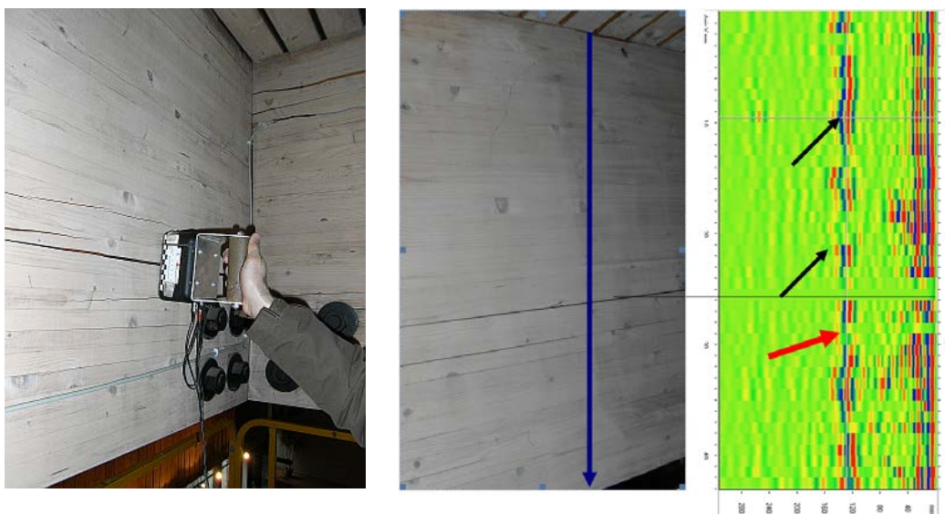
Abbildung 5. Brettschichtholzträger (links Messung im Bereich der Nagelplatte, Mitte ohne Nagelplatte) mit Riss, blauer Pfeil markiert Ultraschallechomessspur; rechts: Ergebnisse, Echos an der Bauteilrückseite (schwarze Pfeile), breiter Riss an Oberflächen (schwarze dünne Linie verbindet Riss in Brettschichtholzträger und entsprechendem Messpunkt im Diagramm ohne Oberflächenwellen und Rückwandecho), Rückwandecho trotz Oberflächenriss (roter Pfeil)

Im Rahmen der Untersuchungen erfolgte eine visuelle Untersuchung einschließlich Risstiefenbestimmung sowie Ultraschallechomessungen. Mit dem Ultraschallechoverfahren konnten an den Brettschichtholzträgern Echosignale sowohl in den Bereichen ohne als auch mit Nagelplatten empfangen werden, d. h. verdeckte Bereiche können mit Ultraschallecho untersucht werden. Trotz Rissen auf der zugänglichen Seite wurden deutliche Rückwandechos empfangen, d. h. es kam zu einem Schallübergang und die nicht zugängliche Seite wies keine Risse auf. An einigen Messpunkten konnte trotz intensiver Oberflächenwelle von der Rückseite kein Echo empfangen werden, was basierend auf Erfahrungen als Riss auf der Bauteilrückseite gedeutet werden kann. Es musste also davon ausgegangen werden, dass sich bei einigen Brettschichtholzträgern auf der Rückseite unter den Nagelblechen Risse befinden und somit nicht alle Nägel als voll kraftschlüssig angesetzt werden können. Mit den Messungen konnten genaue Aussagen über den Zustand der Konstruktion getroffen werden, was in der Statik berücksichtigt wurde.