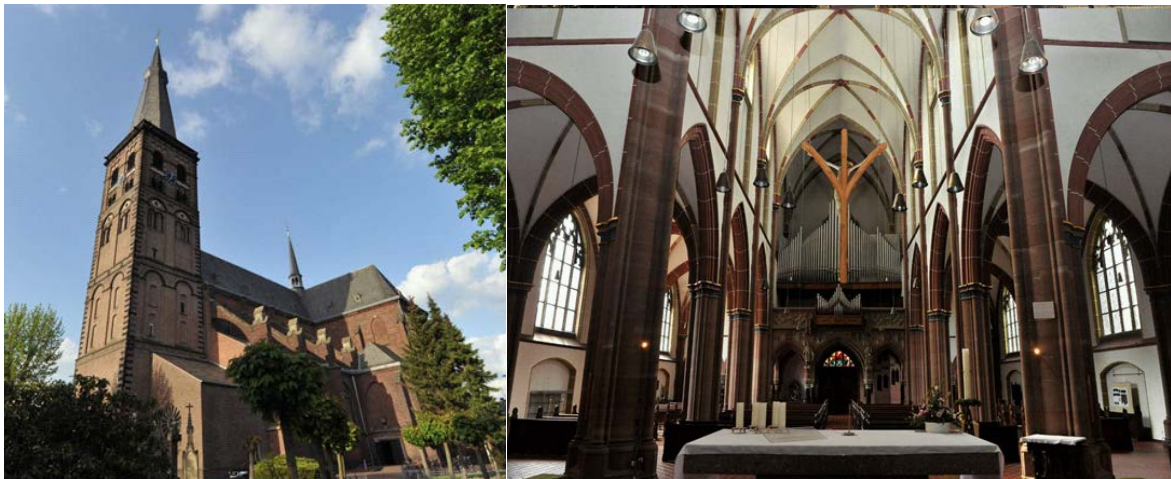
Abbildung 1. Pfarrkirche St. Cornelius in St. Tönis

Die Pfarrkirche St. Cornelius in St. Tönis besteht zu großen Teilen aus einem neugotischen Erweiterungsbau von 1885 bis 1904, einige Bereiche wurden nach dem Zweiten Weltkrieg im gleichen Stil wieder aufgebaut (Abbildung 1).