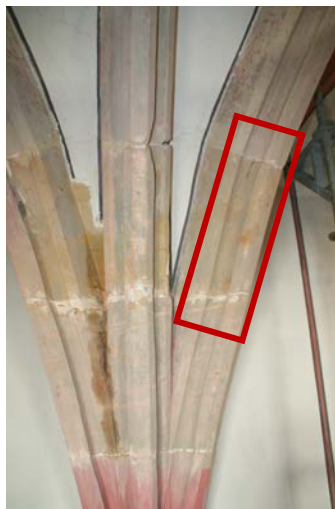
Abbildung 8. Lage der Impact-Echo- und Ultraschallechomessungen in einer gotischen Kirche in Bayreuth

An einer gotischen Kirche in Bayreuth (Abbildung 8) wurden bei Untersuchungen Risse an Sandsteinrhomben festgestellt. Um eine kraftschlüssige Verbindung herzustellen wurden diese Risse verpresst. Der Erfolg dieser Rissverpressungen wurde mit Impact-Echo und Ultraschallecho überprüft. Zudem war bekannt, dass die Steine durch Brandschäden des Dachstuhls beschädigt waren und der Sandstein deshalb an der Oberseite geschädigt sein konnte.