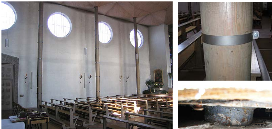
Abbildung 6. links: Innenansicht Kirche; rechts oben: Sanierung der Risse in einigen Holzstützen; rechts unten: Stützenauflager aus Stahl auf Betonfundament

Das Dach der Kirche liegt auf den Außenmauern und Rundstützen im Kircheninneren auf. Bei einer Begehung waren Risse in den Holzstützen auffällig, die daraufhin saniert wurden (Abbildung 6 rechts oben). Dabei stellte sich die Frage nach dem Aufbau der Stützen im Inneren, da visuell nur die runde Holzstütze und ein Stützenauflager aus Stahl auf dem Betonfundament zu sehen waren (Abbildung 6 rechts unten).